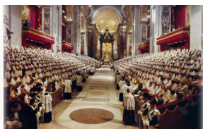
El Concilio Vaticano II

Recen el Rosario y lean el «Tratado» de San Luis María Grignon de Montfort.