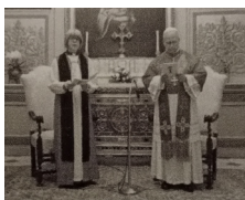
León XIV ora con la arzobispa anglicana

El Papa León XIV está a punto de crear la "Gran Iglesia" con ortodoxos y anglicanos, teorizada por el ecumenismo del Concilio Vaticano II, elaborada por Ratzinger, y ya prefigurado por Juan Pablo II en Asís y en la apertura de la Puerta Santa en el año 2000. El Papa León XIV ora con la arzobispa anglicana. Foto y texto del OR 27.04.2026, pág. 4: «Su Gracia... Orando juntos... hoy... Restablecimiento de la plena comunión... Que Dios la bendiga a usted y a su familia».