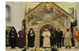
Benedicto XVI conmemora Asís

Los papas del Vaticano II enseñan lo contrario de los Papas de antes. ¿Cómo desobedecer a la doctrina que todos los Papas siempre y en todo lugar enseñaron?